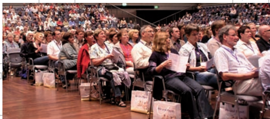
Gespanntes Interesse in den Rhein-Main-Hallen